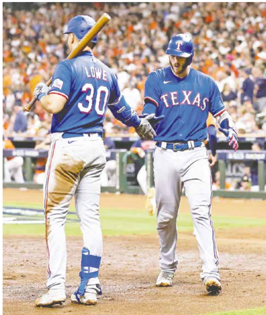
El pase a la final se decidirá en un séptimo juego.