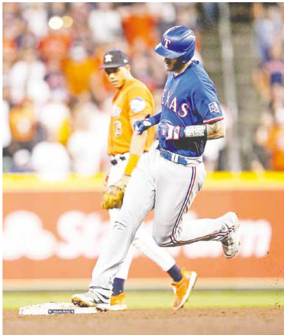
Simplemente las jugadas le salieron mejor a Rangers.