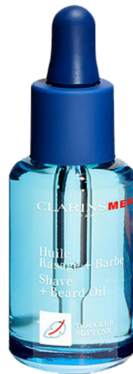
Aceites de afeitado.

También son muy recomendables para las barbas, ya que se crea una barrera que evita la evaporación de agua. De esta forma la zona aparece completamente hidratada, sin sensación grasa.