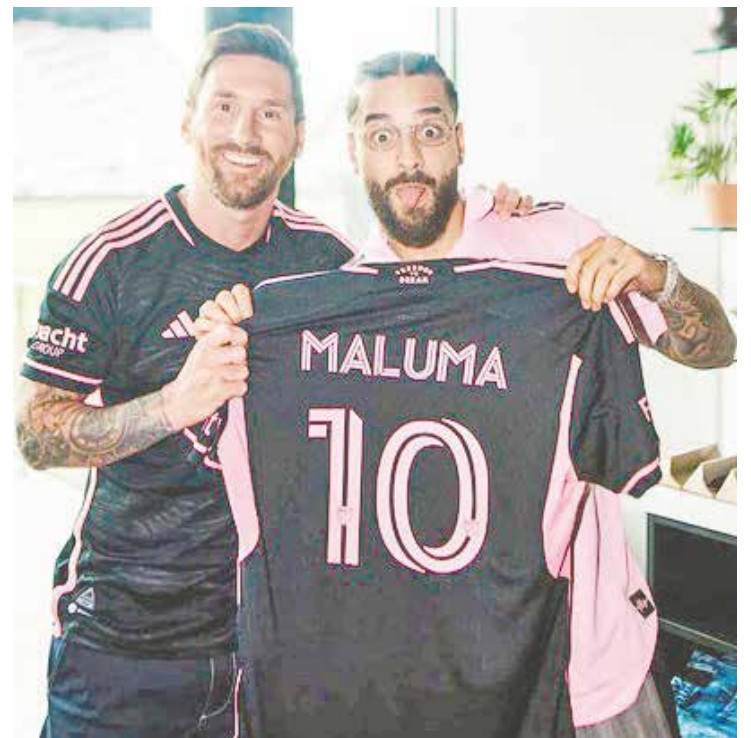
Messi le regala su playera a Maluma.

En ronda de penaltis el argentino tampoco falló, tampoco ninguno de sus compañeros.