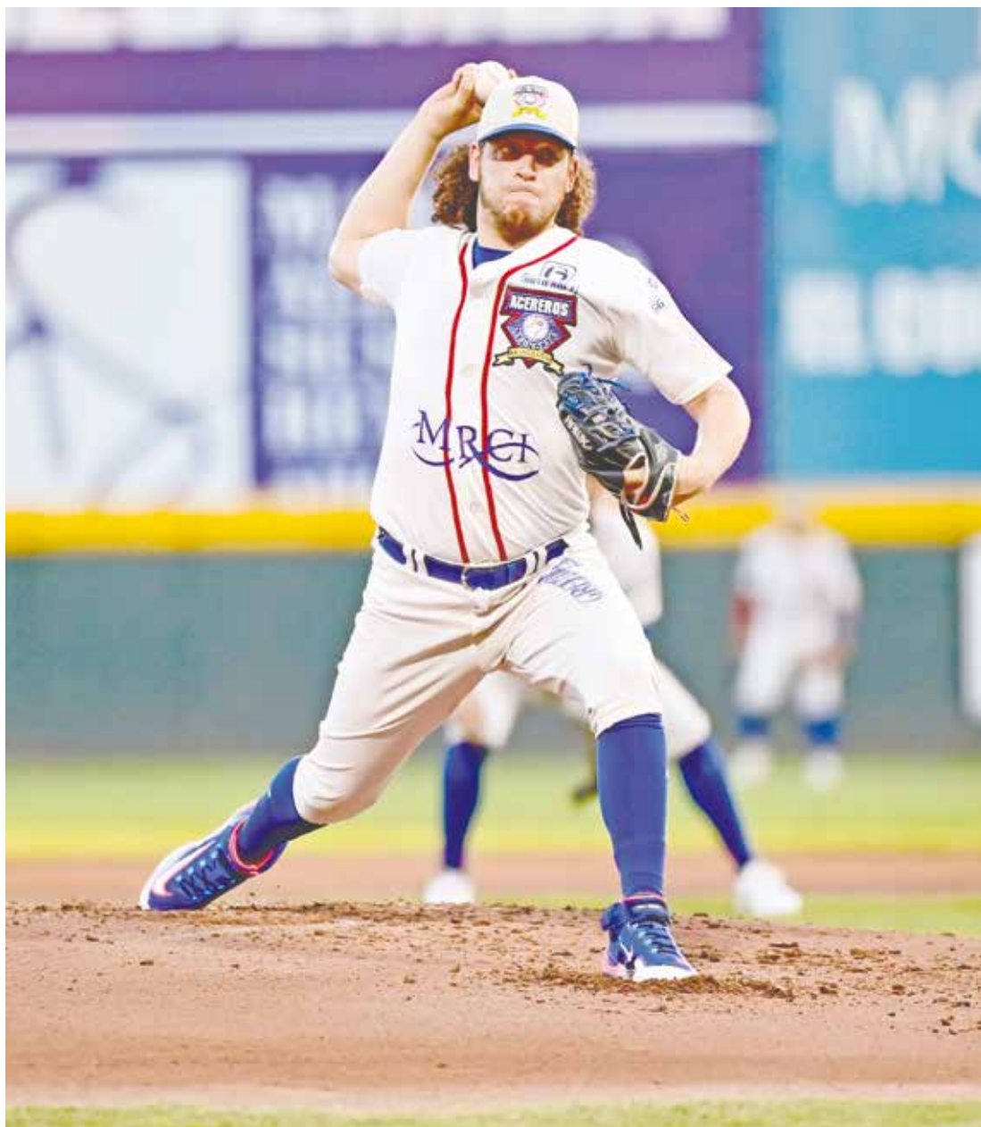
Los Acereros están en la postemporada y abren serie ante los Tecolotes.