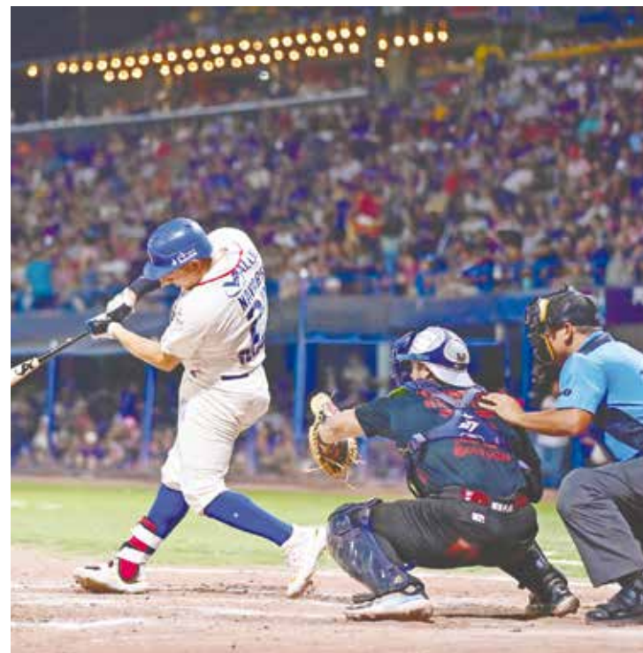
Los Acereros vinieron de atrás y terminaron ganando a los Algodoneros.