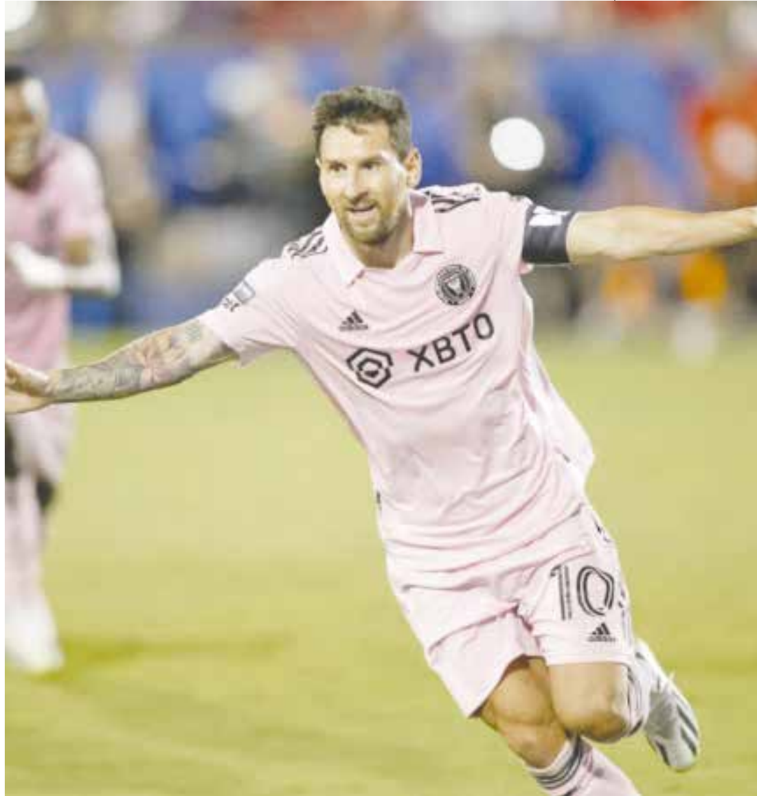
El Inter supera al Dallas en tiros de penaltis.