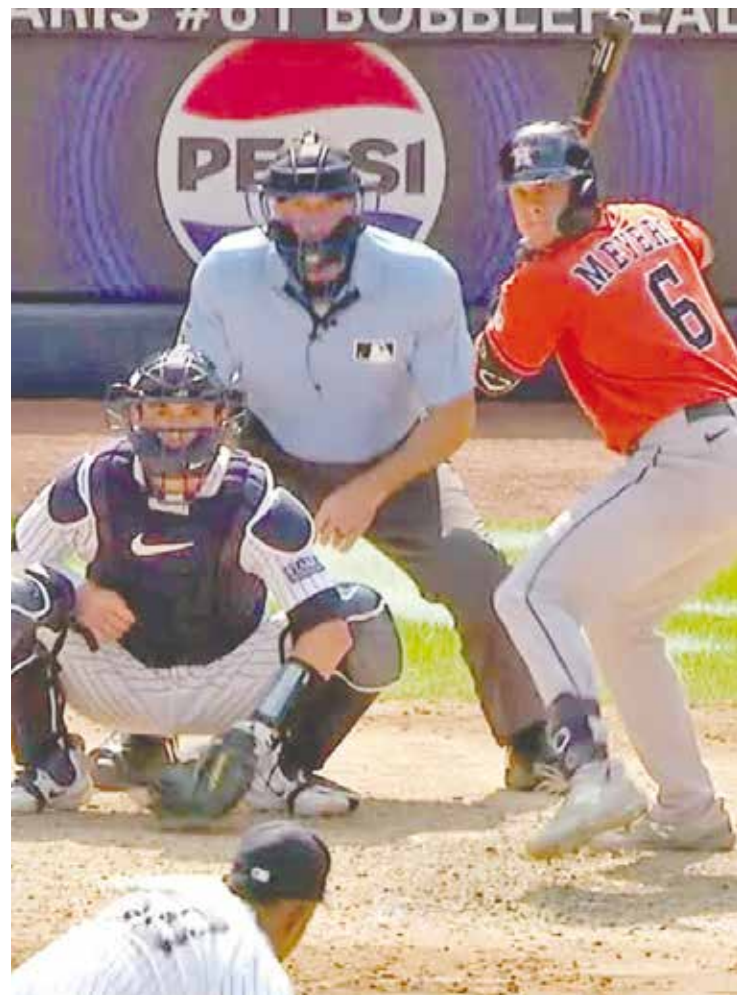
Astros ganan 9-7 a los Yankees.

Orioles 2 Mets 0. Kyle Bradish y cuatro relevistas se combinaron para permitir apenas cuatro hits y los Orioles de Baltimore completaron la barrida en una serie de tres juegos ante los Mets de Nueva York, con una victoria de 2-0 el domingo. Adley Rutschman y Ryan O'Hearn remolcaron una carrera cada uno para Baltimore. Los líderes de la Liga Americana han ganado ocho de sus últimos diez juegos. El cubano Cionel Pérez (4-1) relevó a un errático Bradish con dos outs en el quinto, y retiró a DJ Stewart en un rodado con las bases llenas.