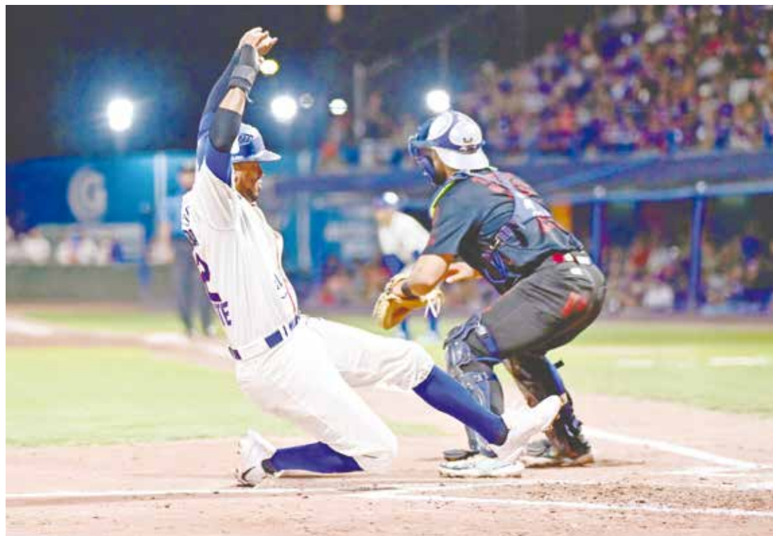
Tremenda ofensiva desplegaron los Acereros para ganar el juego.