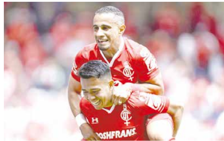
El Toluca se llevó el triunfo ante Mazatlán.

Aunque en la recta final los de casa no cesaron en su empeño por empatar, todo quedó en ello, por lo que a final de cuentas Rayados se llevó los tres puntos en disputa.