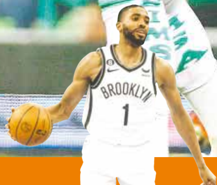
Victoria de los Nets y tercera derrota en fila de los Nuggets P.8