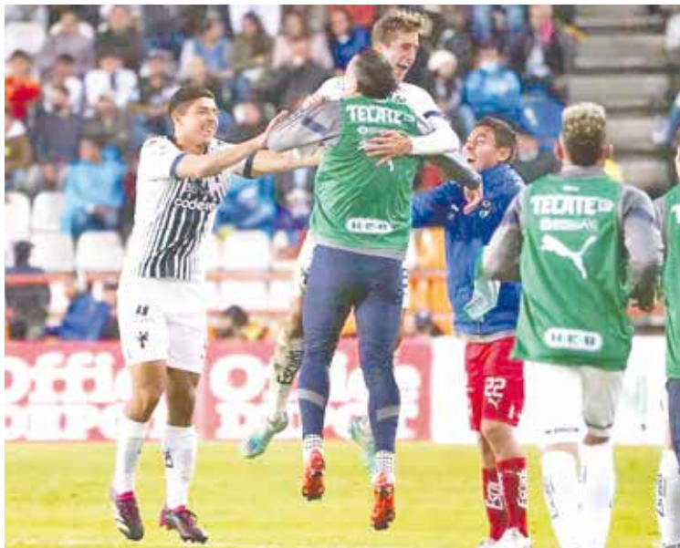
Noveno triunfo para Rayados ante el Pachuca.