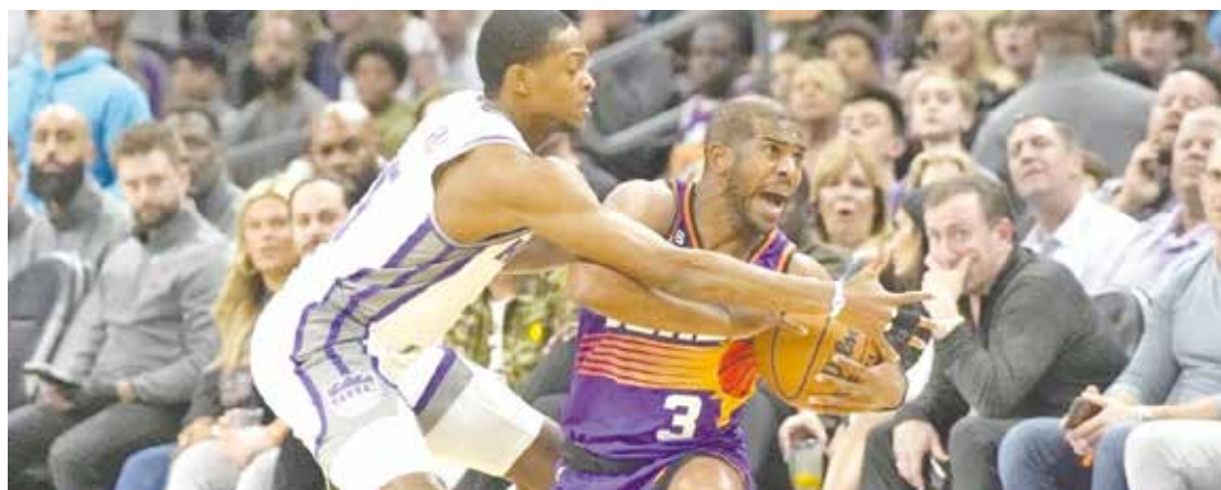
Sacramento Kings consigue ganar a Phoenix Suns.

victorias que ostentaba Phoenix. Los Kings se colocaron tres juegos y medio delante de los Suns, en la lucha por el tercer sitio de la Conferencia Oeste, de cara a los playoffs. Los Kings finalizaron el partido con una racha de 13-4. Siete jugadores de Sacramento anotaron al menos 12 puntos. Dominant Sabonis totalizó 17 y lideró a su equipo en el rubro de rebotes con ocho. Los Suns jugaron su segundo encuentro consecutivo sin su flamante adquisición Kevin Durant. El astro se lastimó un tobillo durante el calentamiento previo al compromiso del miércoles. El club ha informado que Durant sufrió un esguince del tobillo izquierdo y se le evaluará de nuevo en tres semanas.