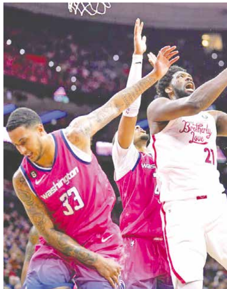
76ers logran superar a Wizards.