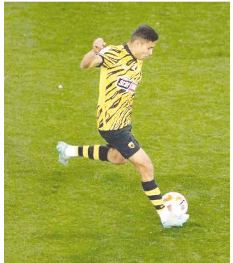
El Aek pierde y se aleja de la cima.