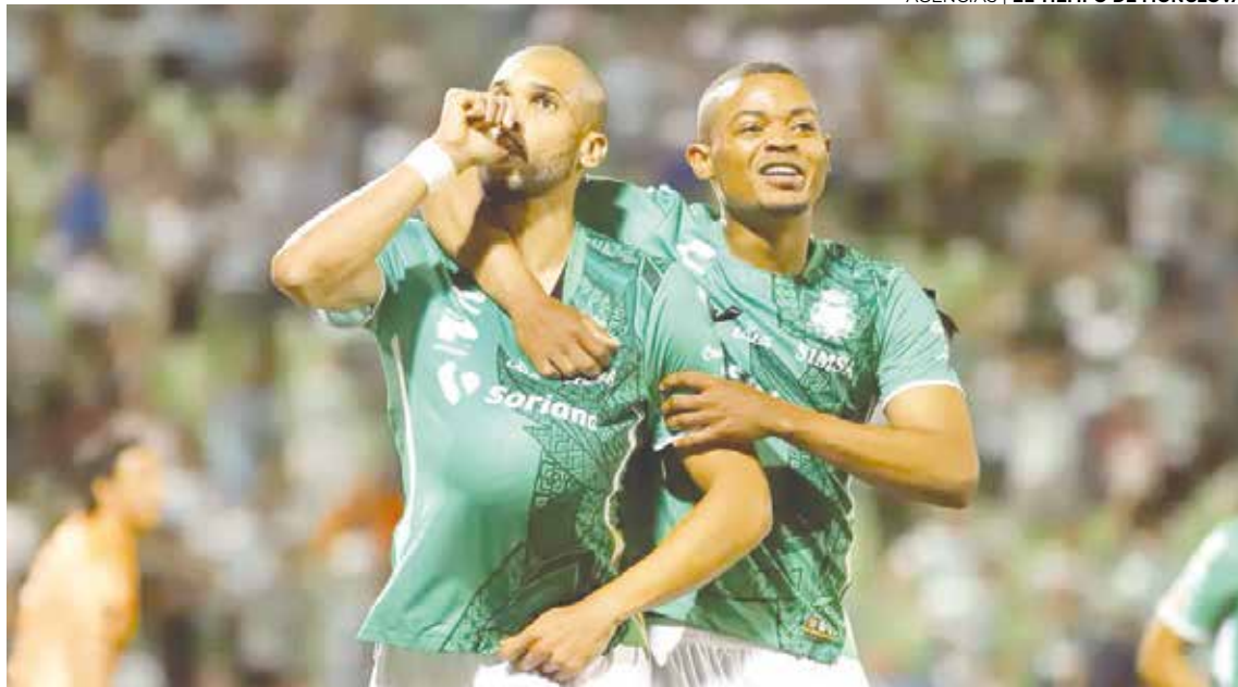
Santos gana en casa ante Tijuana y celebra en grande el triunfo.