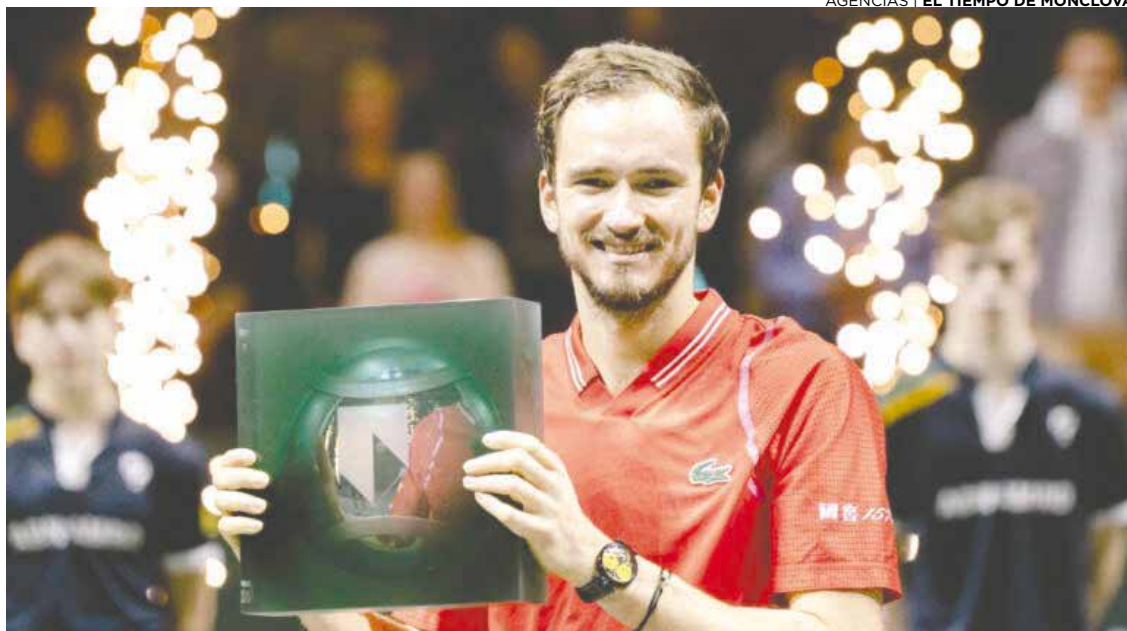
El tenista ruso Daniil Medvedev vuelve al Top 10 de la ATP.