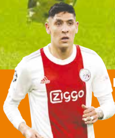
Edson Álvarez salió lesionado en la goleada del Ajax P.4