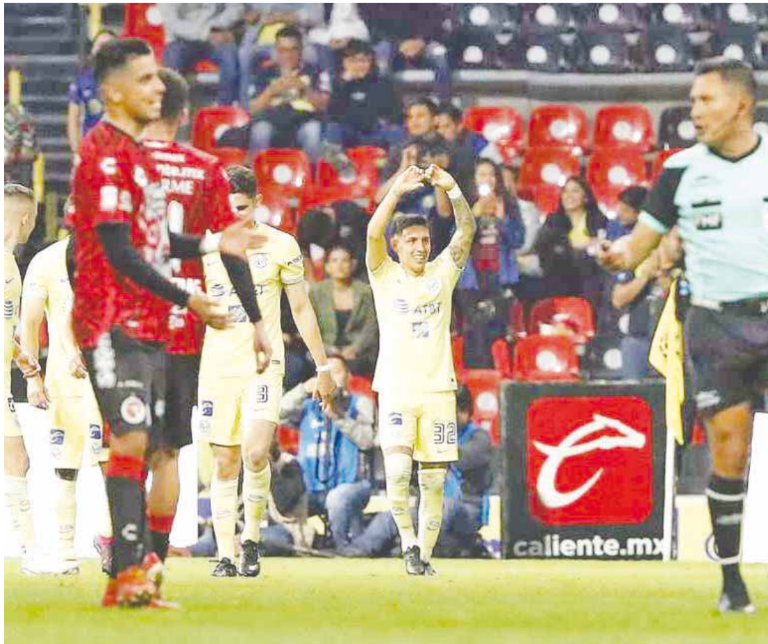
El América se mantiene invicto y ayer le gana a los Xolos por 2-1.

FÚTBOL Las Águilas resistieron la reacción de Tijuana en los minutos finales para llevarse los 3 puntos.