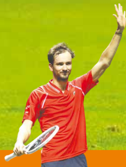
Medvedev vuelve a ser campeón; Róterdam lo regresó al top 10 P.26