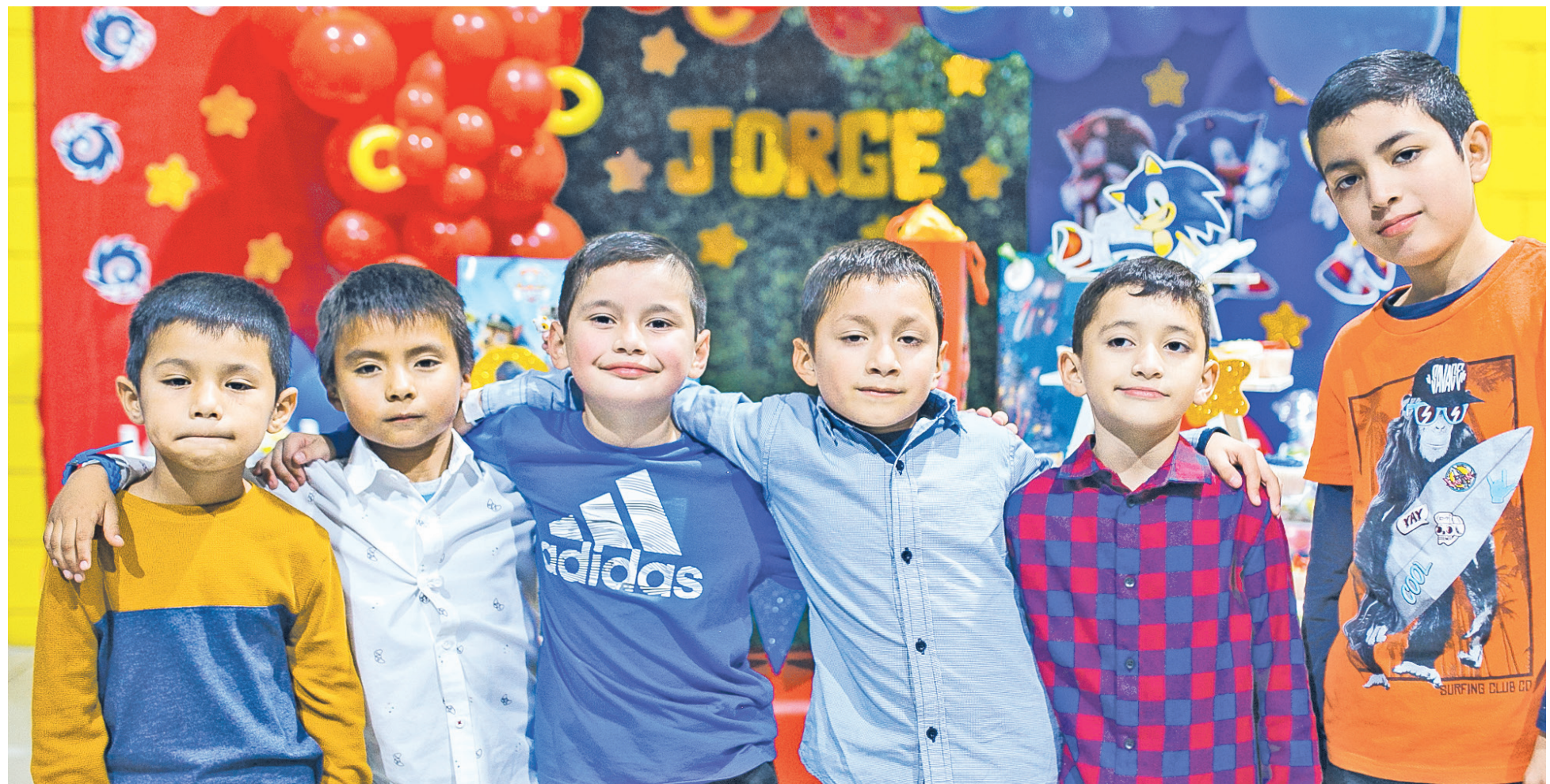
Sus mejores amigos estuvieron presentes.