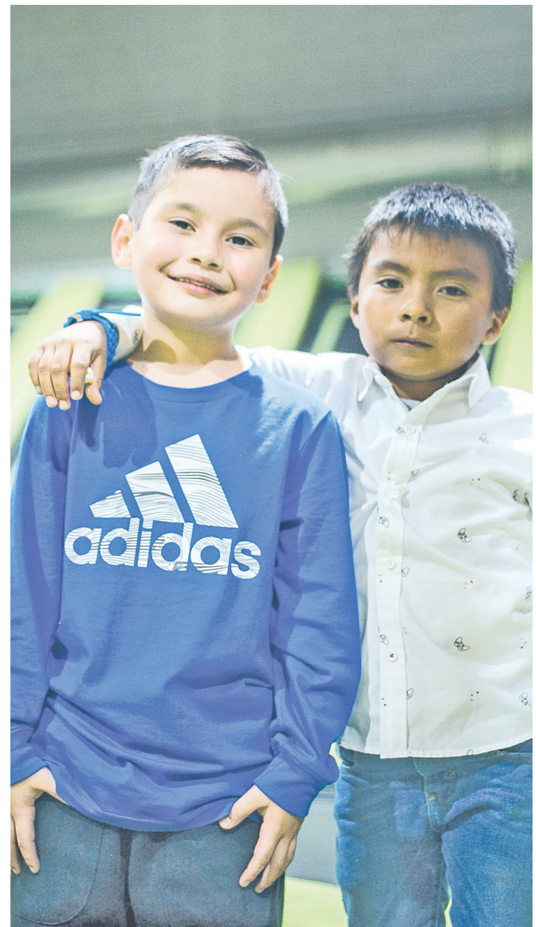
Fueron horas de juego en el área de brincolines.