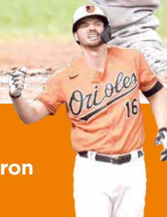
Orioles ganan a los Piratas por 8-1 P.6