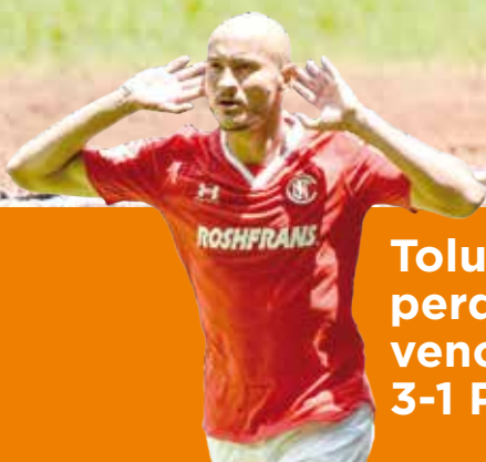
Toluca empezó perdiendo pero vence a Xolos 3-1 P.4

Los Acereros de Monclova ganaron la última serie de la temporada regular y se preparan el martes para recibir a Sultanes al inicio de playoffs. Pág. 8