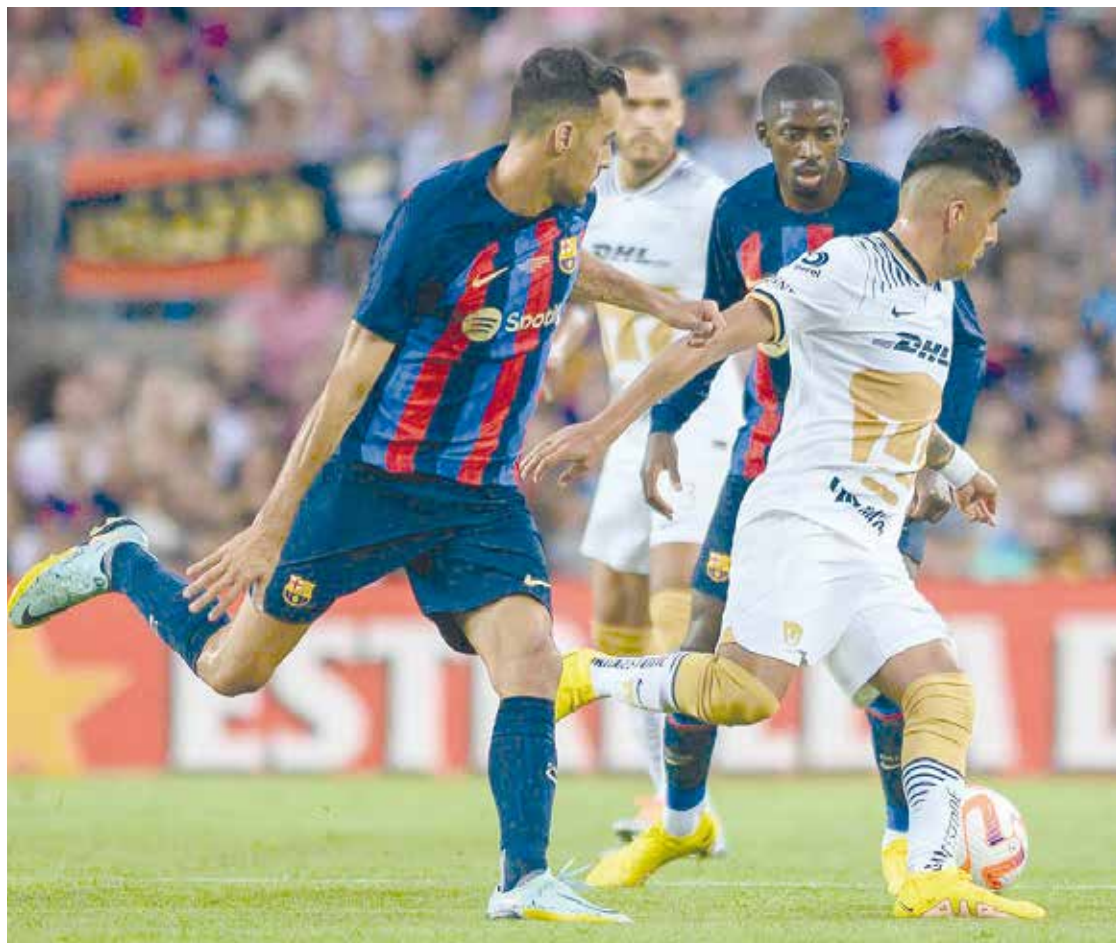
Barcelona goleó al Pumas que no superó su pánico escénico.

FÚTBOL Con goles de Lewandowski, Pedri (doblete), Dembélé, Aubameyang y De Jong.