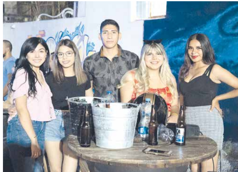
Grandes amigas disfrutando de un increíble concierto.