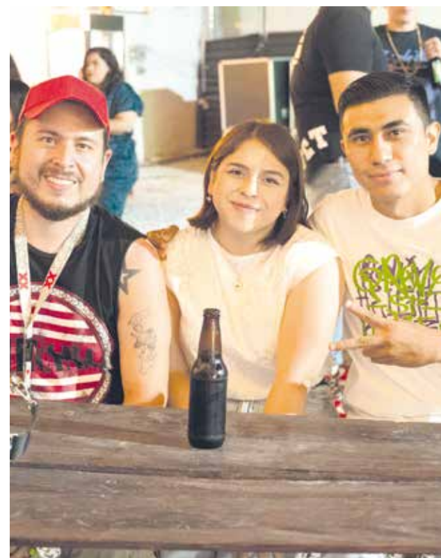
El amor también hizo magia, pues entre amigos y pareja se disfruta mejor.