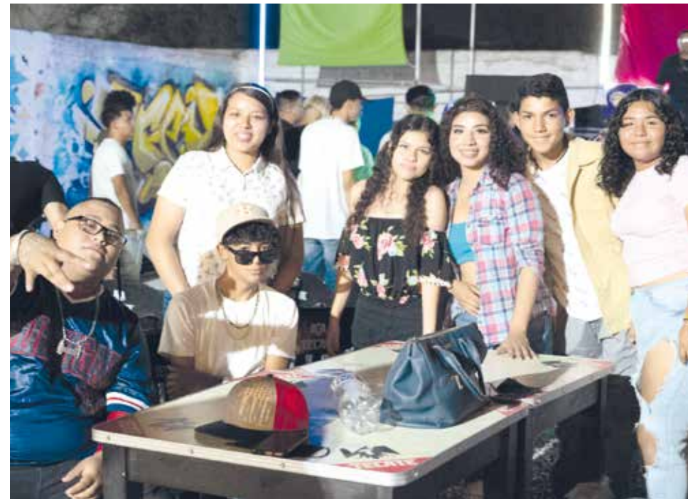
Los cantantes que hicieron presencia esa noche, disfrutaron de la música de sus colegas en conjunto de sus amigos.