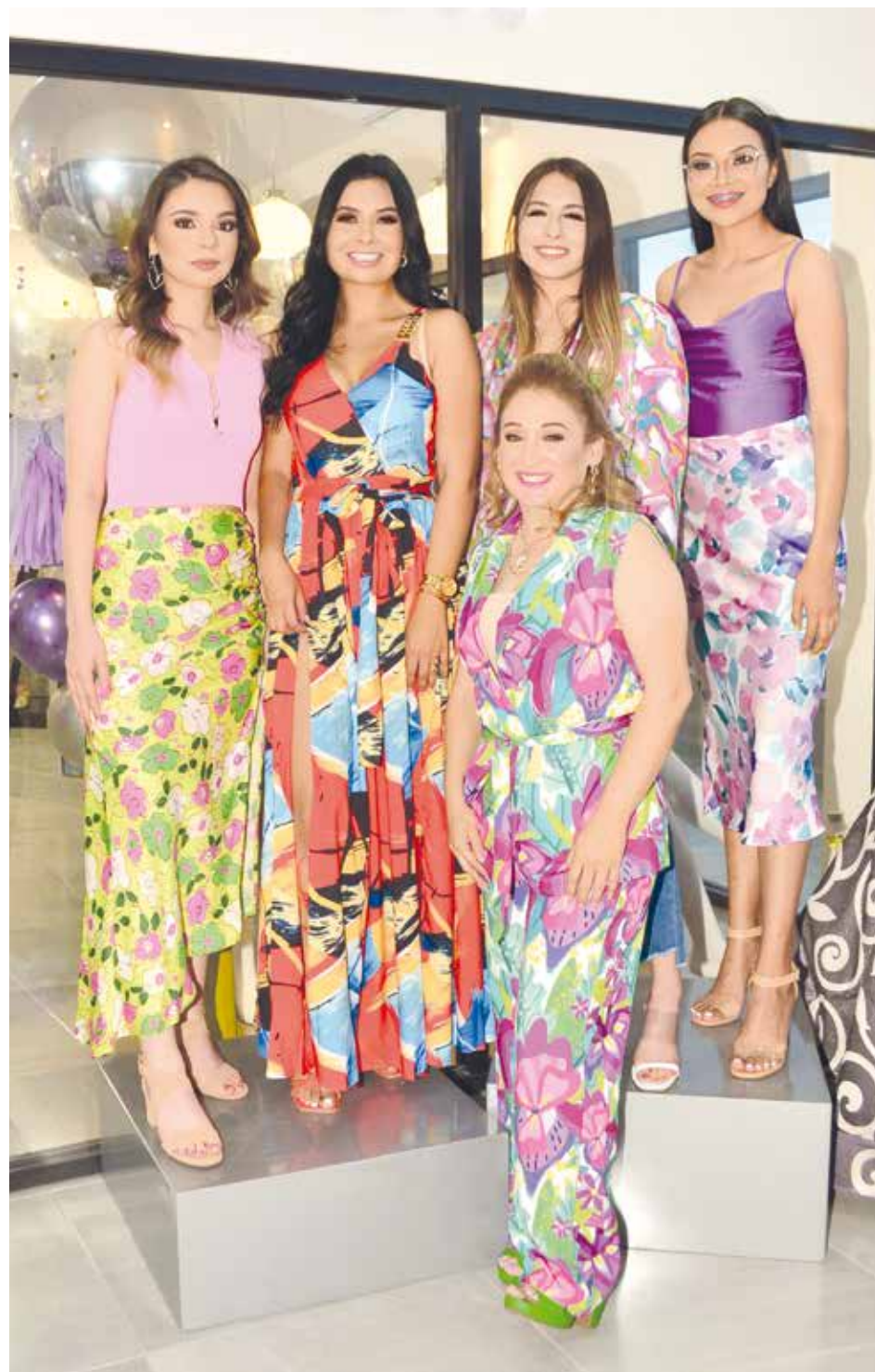
No pudieron faltar las hermosas modelos que mostraron un poco de la colección primavera-verano en este 2022