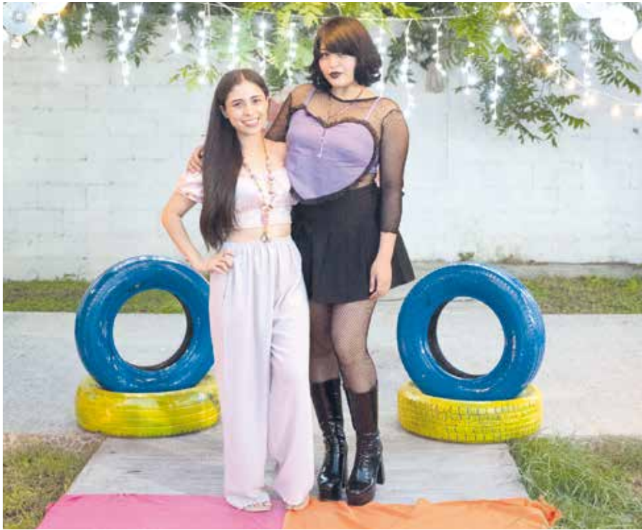
Dueñas de 'Dayanara Bazar' y 'Anhelos Clothing'