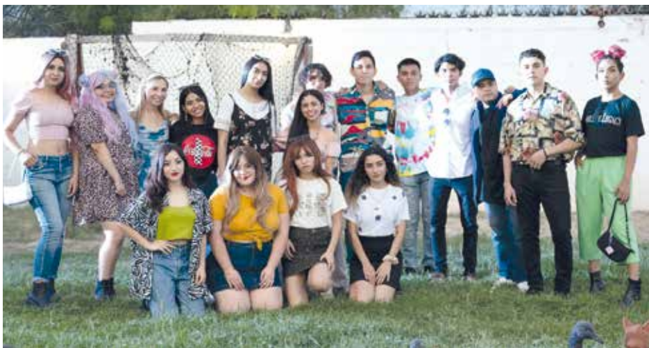
Los modelos de esta increíble pasarela en conjunto con la colaboradora de 'Dayanara Bazar', hicieron magia.

Fest' tenía como objetivo, demostrar que la moda es para todos. "No importa tu físico, tu color de piel, si eres gordo o flaco, hombre o mujer, la moda es para todos y lo importante es que te sientas tú y cómodo", dijo la organizadora. Fue así como los estudiantes en la carrera de Ciencias de la Comunicación dieron por concluido su proyecto final en UANE, dando por casi culminada esta increíble etapa, cerraron "broche de oro", un ciclo de su vida y preparación.