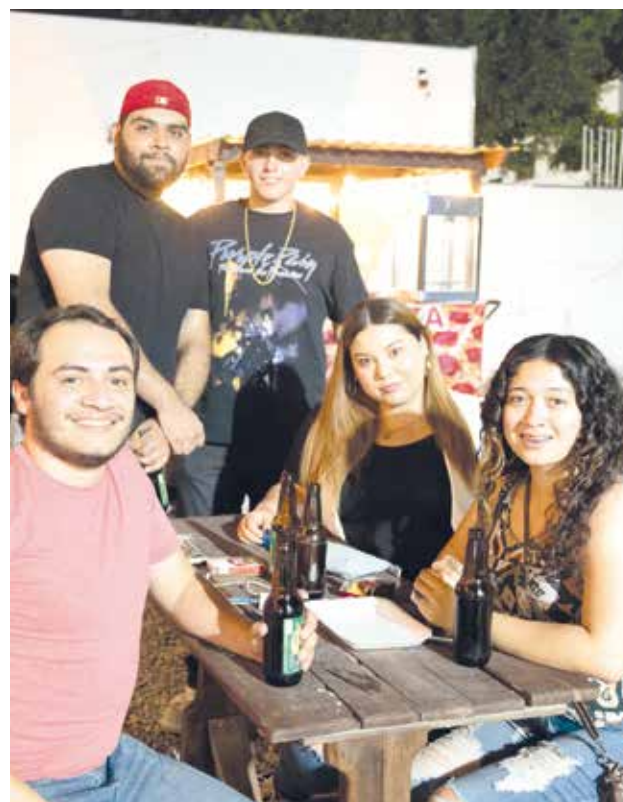
Música y buena compañía fue el 'combo' perfecto para esta noche.