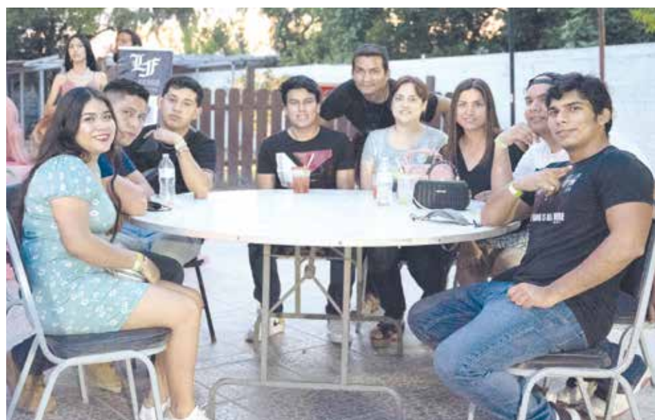
Invitados disfrutando de buena música y bebidas refrescantes.