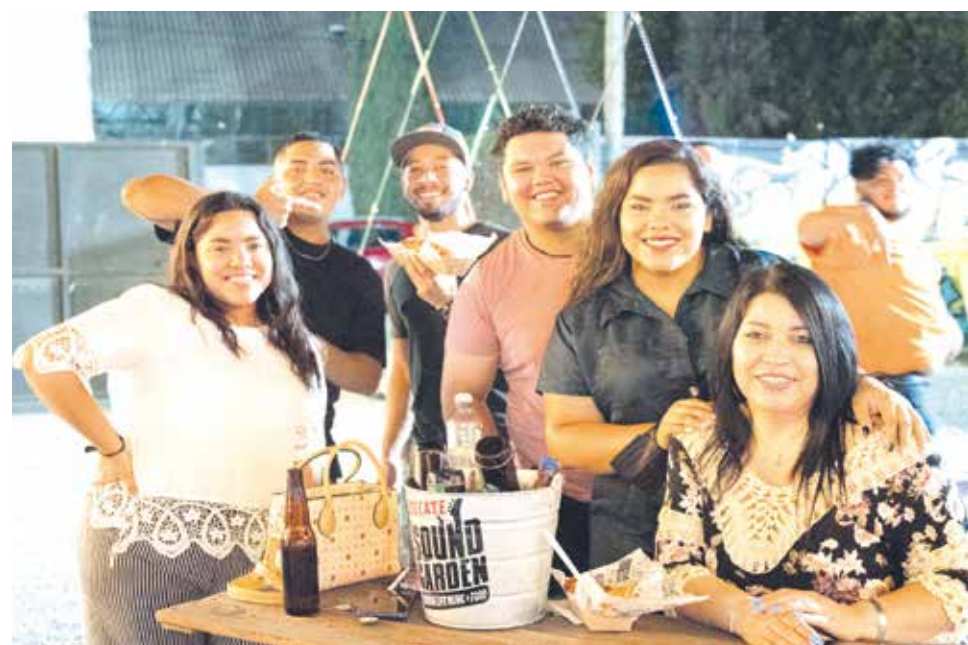
El público disfrutó de buena música y compañía.