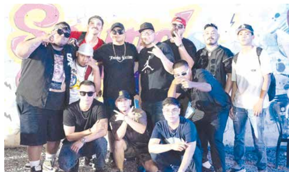
Grandes cantantes urbanos que pertenecen al sello discográfico "STAY HIGH".