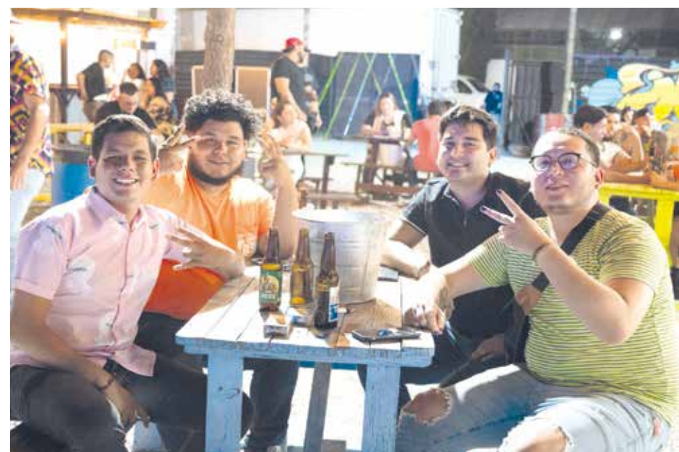
"Entre amigos se disfruta mejor", dijeron los asistentes. Fue así como compartieron una increíble noche.