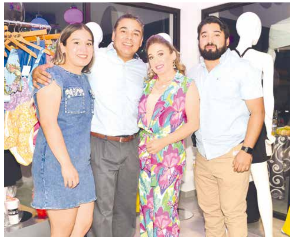
Festejando a lo grande este increíble logro.