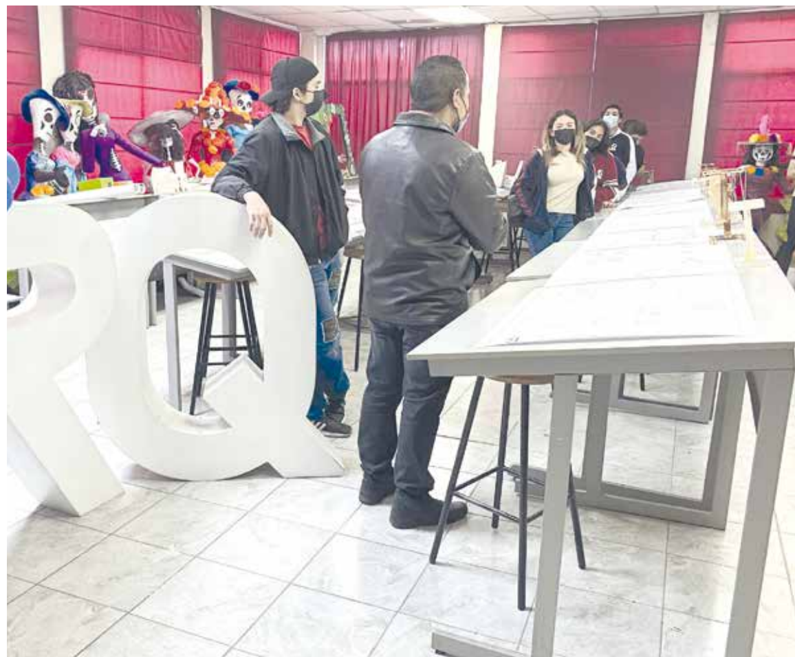
Alumnos de Arquitectura presentaron sus actividades a los asistentes.