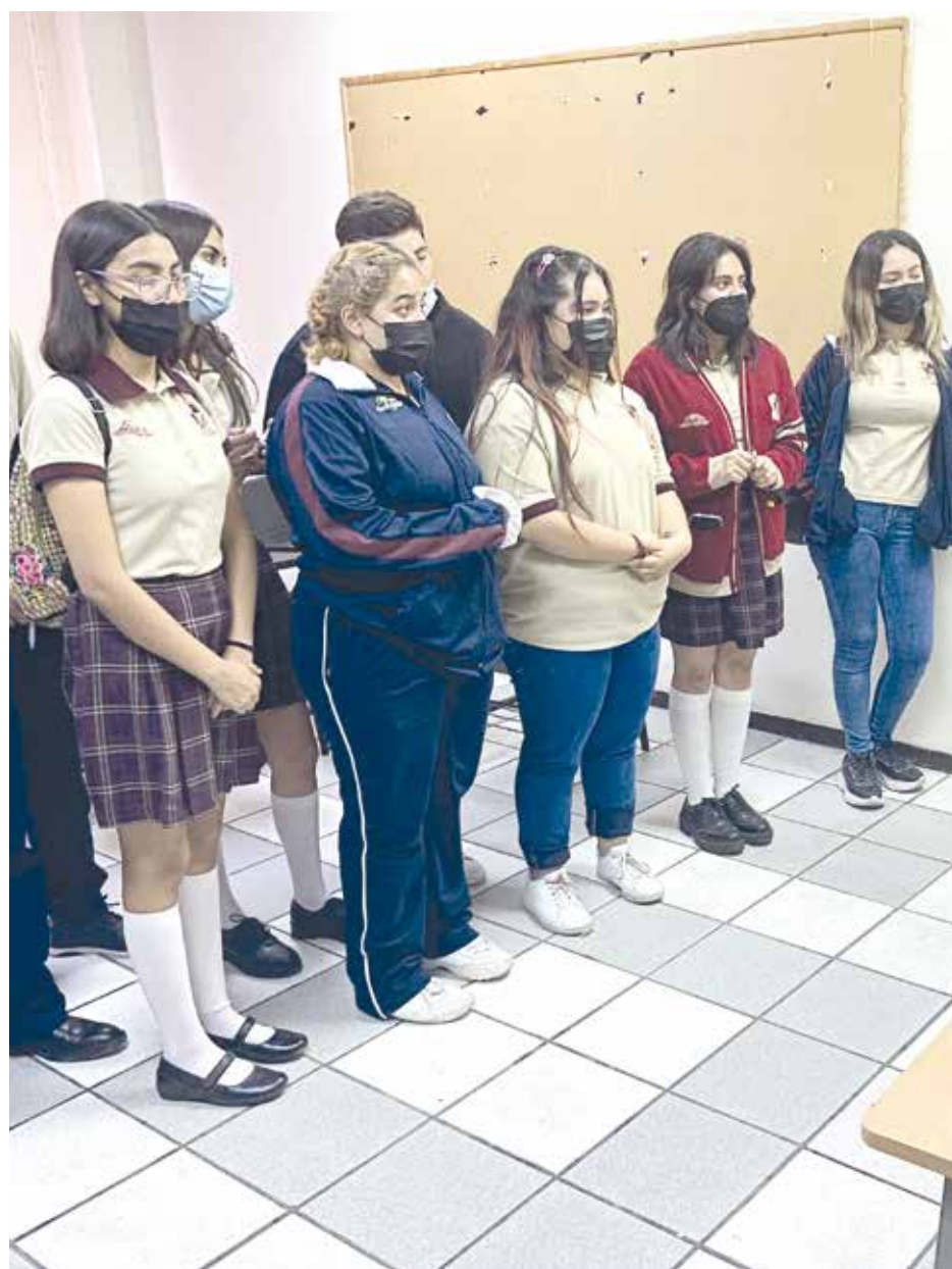
Los docentes estuvieron presentes para hablar sobre lo que se puede aprender en las carreras.