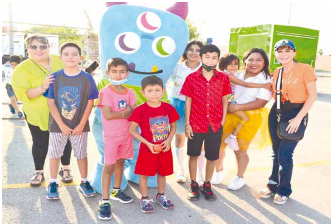
Los más pequeños también disfrutaron de un tiempo de diversión.