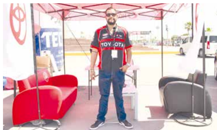
Los chicos de Toyota Monclova se dieron cita para dar a conocer sus grandes promociones.

Esperan que la edición se repita cada año para seguir dando a conocer cada vez a más emprendedores.