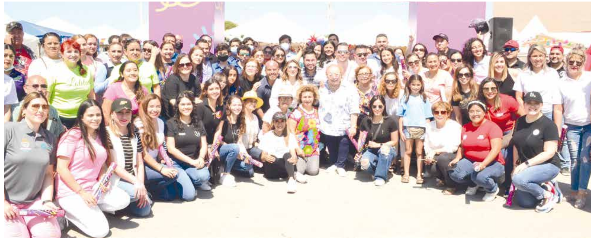
Asistentes, participantes e invitados especiales a la Emprende Market.