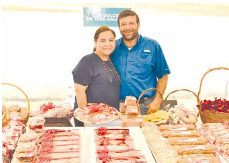
No podían faltar los tradicionales y deliciosos dulces de leche que antojaban a todos a su paso.