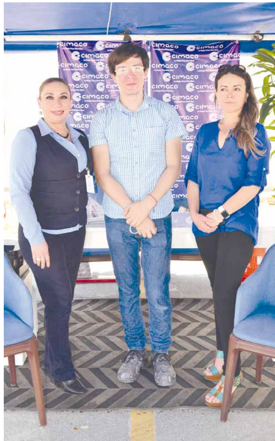
Las grandes empresas también estuvieron presentes.