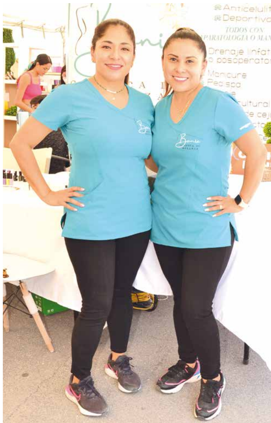
Clínicas de Spa presentaron sus servicios para consentirse a uno mismo y pasar un tiempo de relajación.