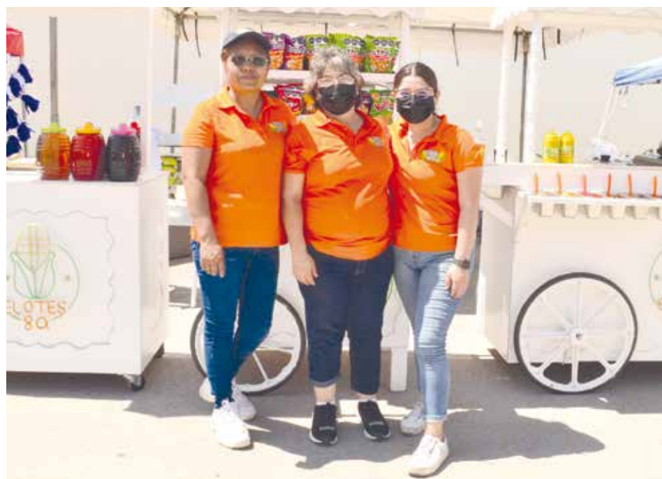
Fue una excelente oportunidad para dar a conocer los negocios de yukis y elotes con sabores únicos.