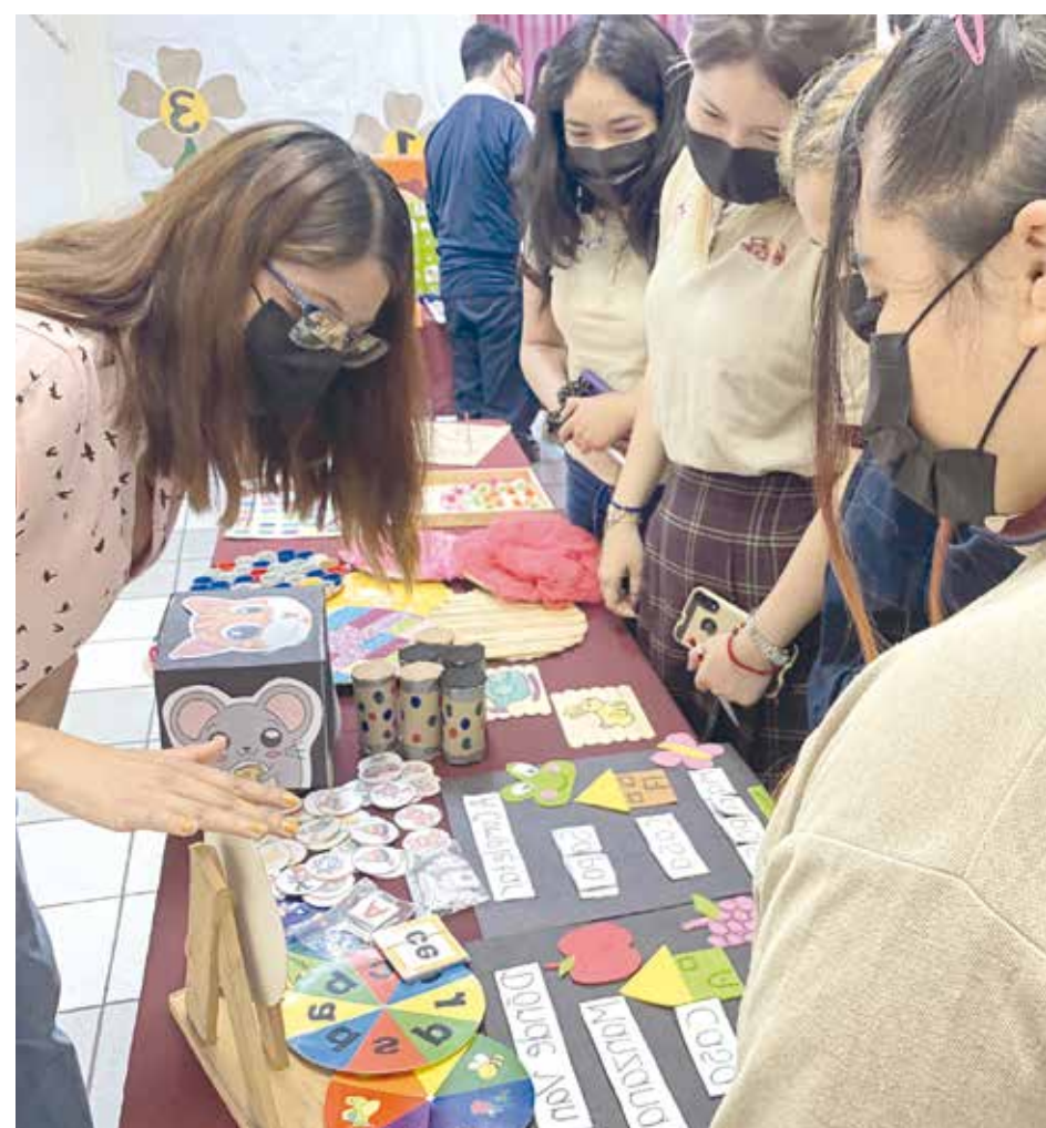
Los alumnos de Educación presentaron diferentes actividades a los estudiantes del Colegio Vizcaya.

El personal administrativo y docente estuvo presente para dirigir el Open House, donde distintas preparatorias y secundarias de la ciudad asistieron para poder conocer más sobre la oferta académica con la que cuenta la institución, donde además se llevaron grandes sorpresas, y muchos recuerdos para tomar una decisión a futuro.