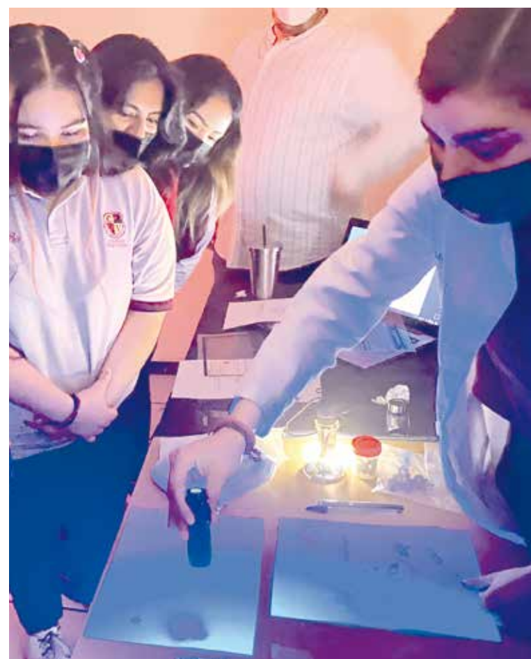
Quedaron maravillados con las prácticas de criminología.