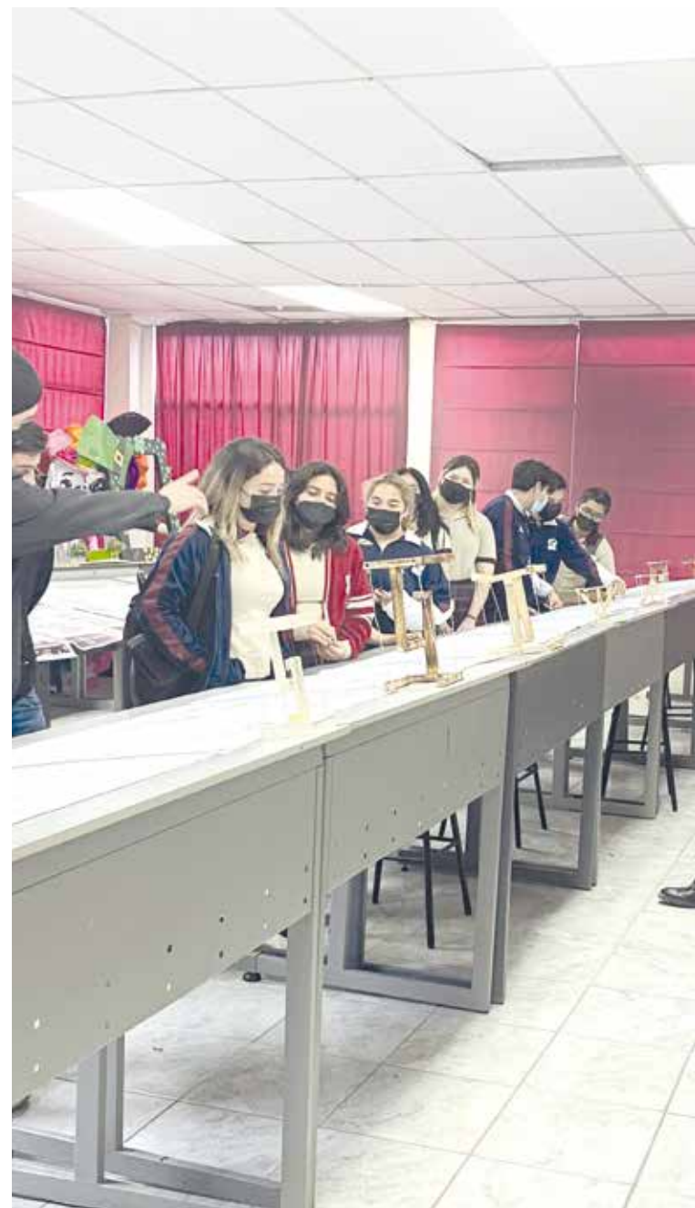
Además, también dieron a conocer los laboratorios.