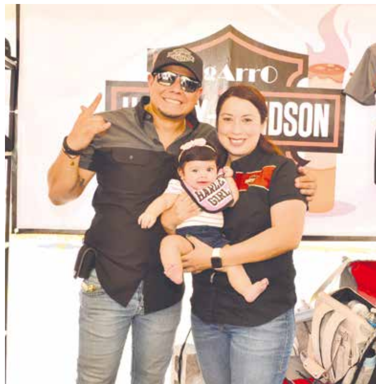
Familias estuvieron disfrutando de dar a conocer sus negocios especiales.