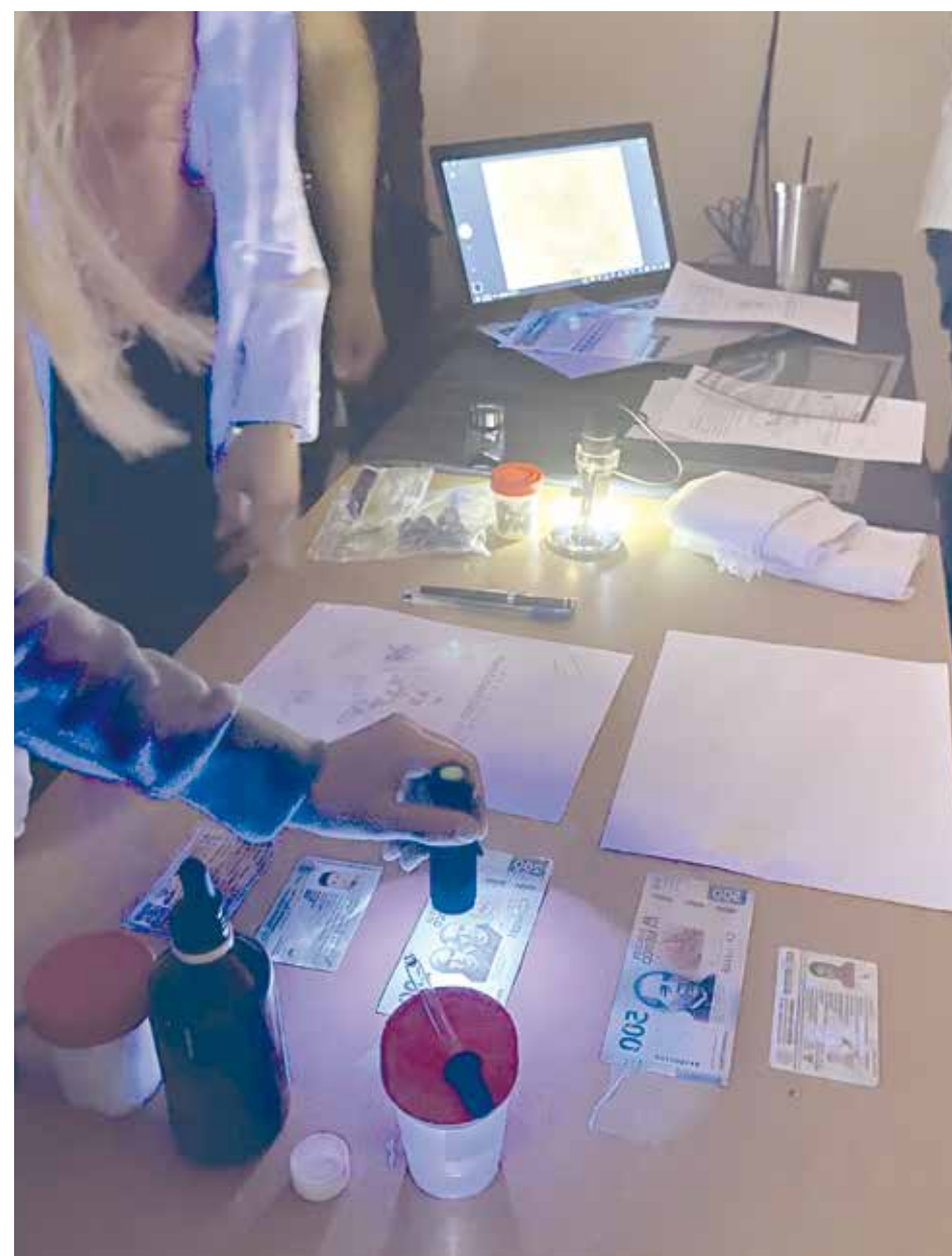
Muchos de los asistentes se asombraron con las maravillas de las prácticas en Criminología.