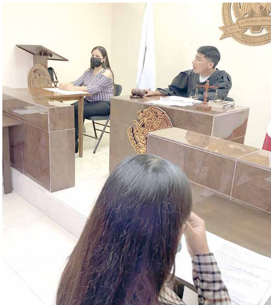
Los alumnos de licenciatura en Derecho presentaron un caso de juicio oral como ejemplo de lo que se vive en la preparación profesional.