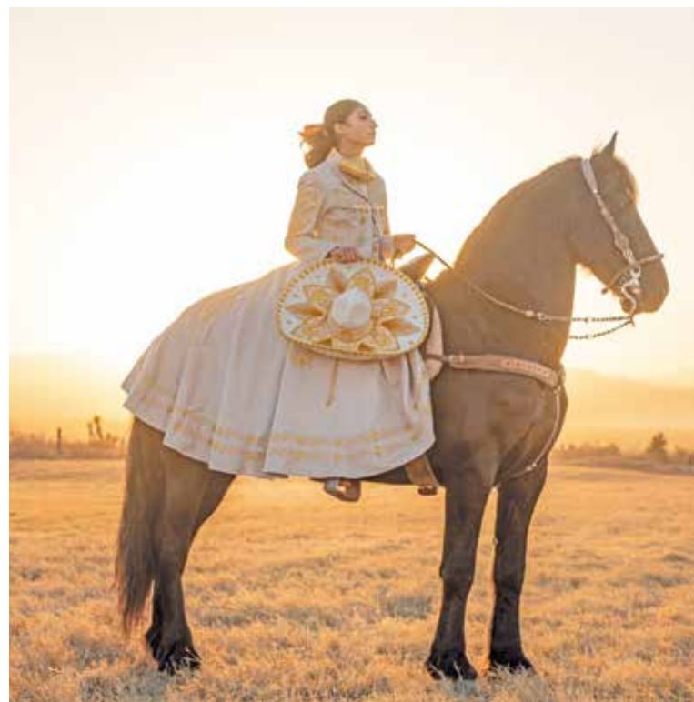
Montar a caballo es tomar prestada la libertad con un movimiento rítmico y suave.