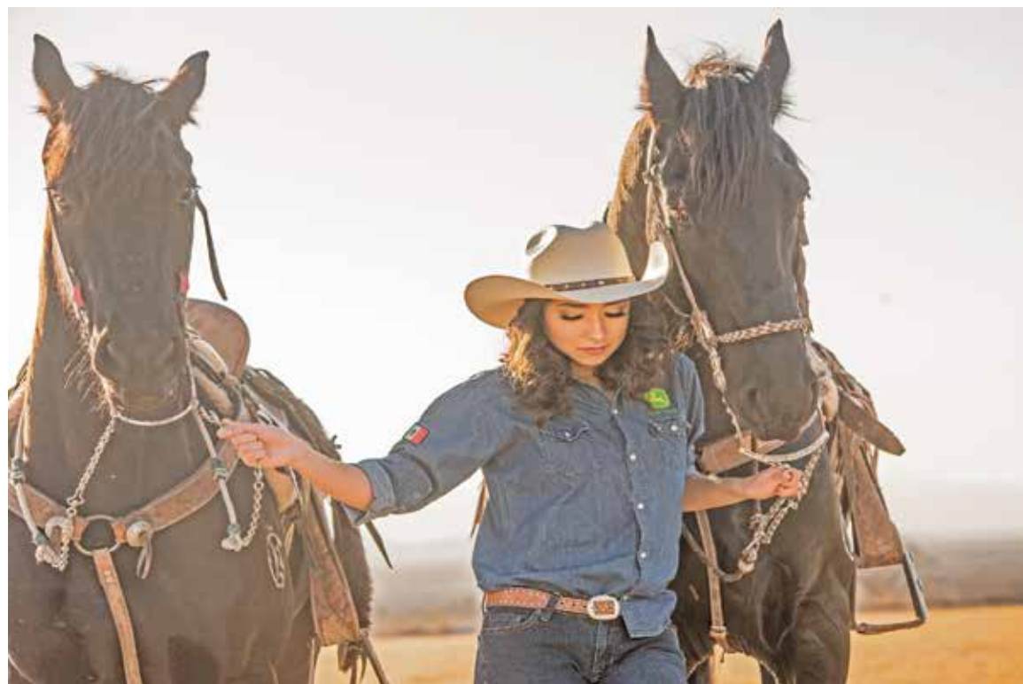
Hasta que no has amado a un animal, una parte de tu alma permanece dormida.