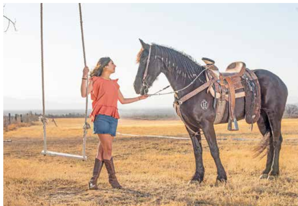
En los ojos del caballo brillan estrellas llenas de sabiduría y coraje para guiar a los hombres de los cielos.