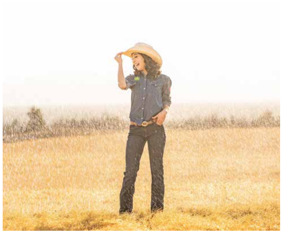
La cumpleañera disfrutó mucho su sesión.