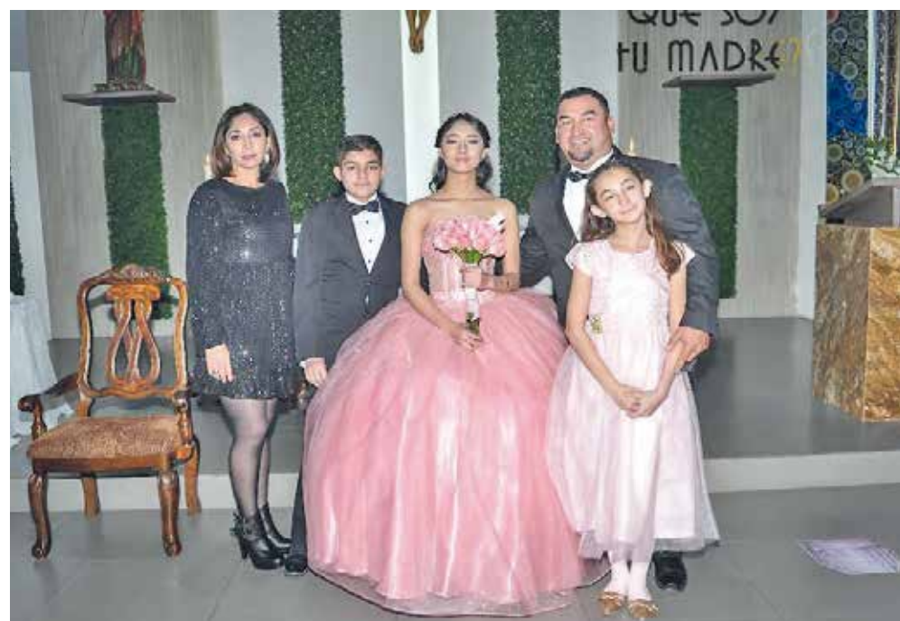
Lució además un hermoso vestido rosa en la ceremonia religiosa con el fin de dar gracias por su aniversario.