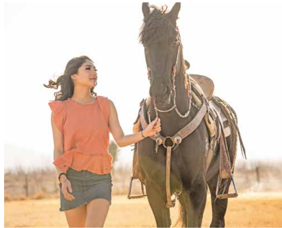
La vida es un galope corto, profundo y sencillo, pero a caballo es fuerza y espíritu, así como libertad y confianza.