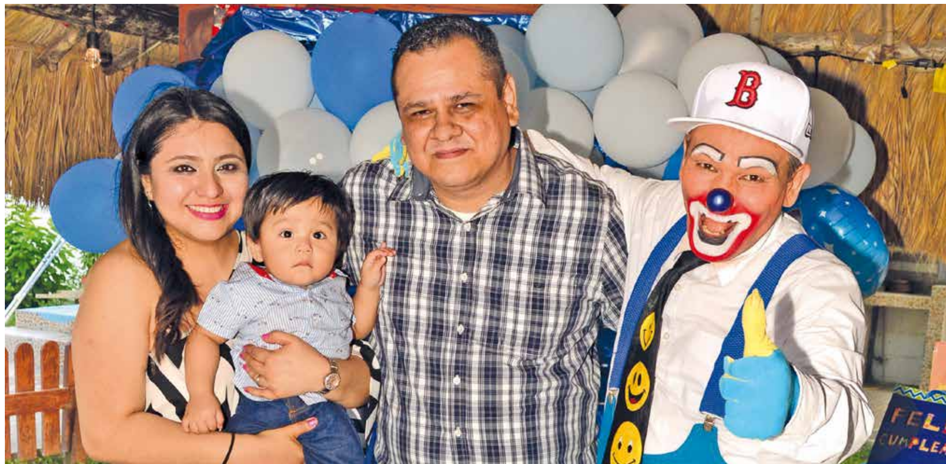
Un excelente y divertido show de payaso acompañado de muchas risas amenizó la tarde.