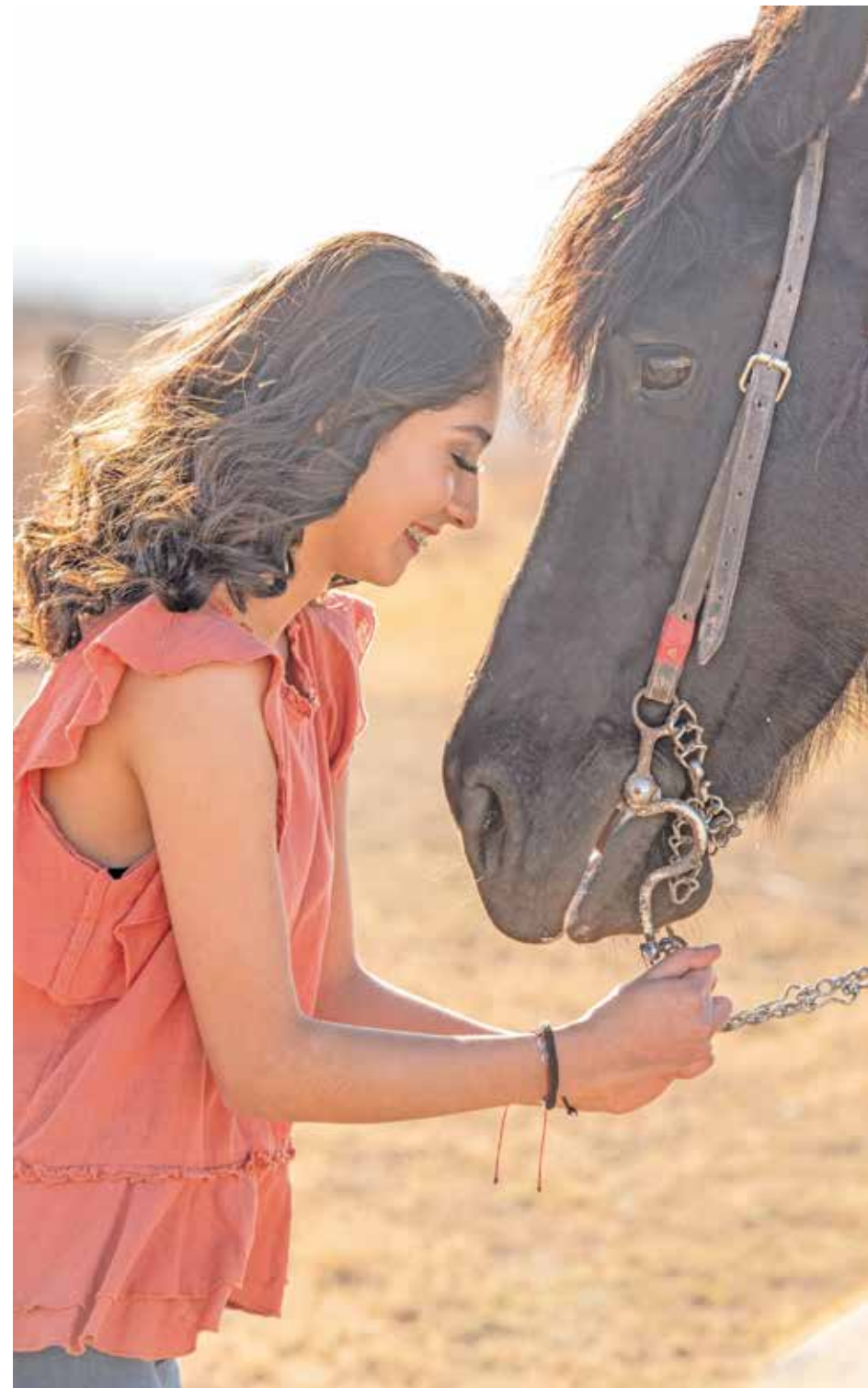
Del caballo aprendí que la fuerza se complementa con la nobleza.