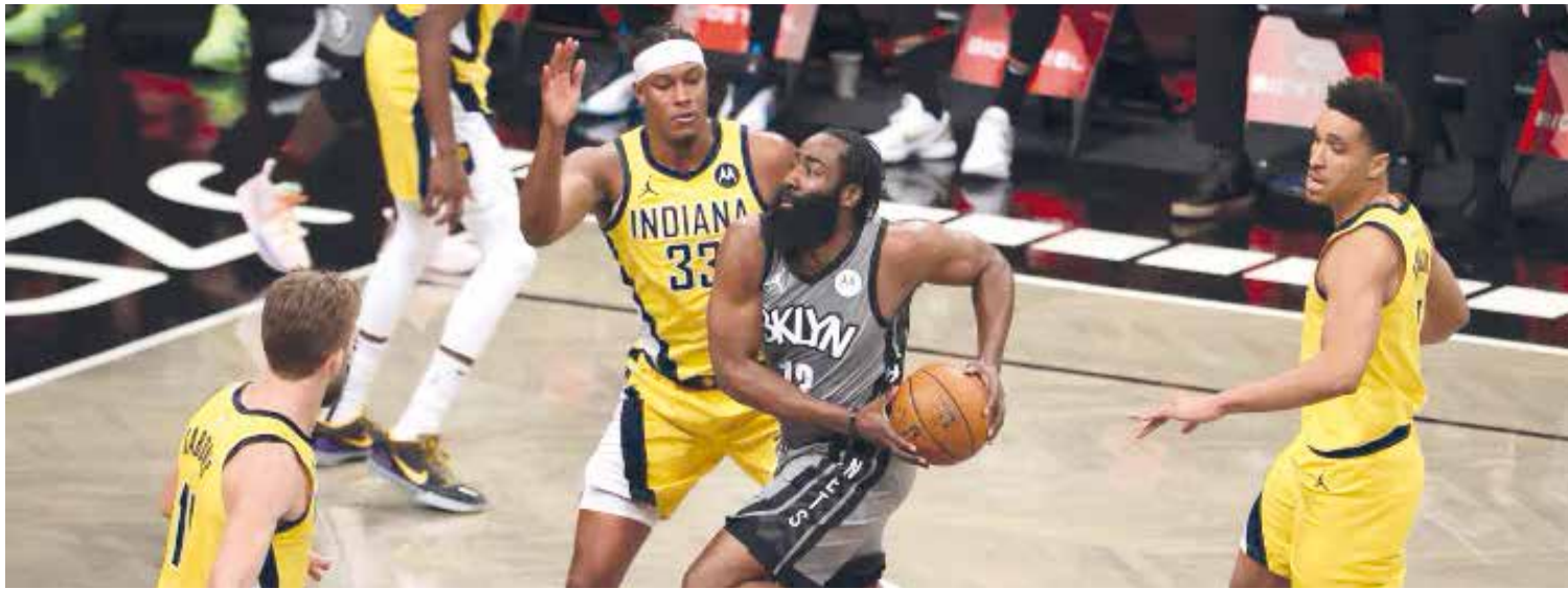
Los Nets de Brooklyn ganan con Kyrie Irving y Kevin Durant al frente.