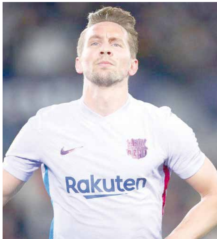
El Barcelona controló al Levante.

FÚTBOL El Barcelona se posesiona del sub liderato de la Liga Española, pese a la apretada victoria ante Levante.