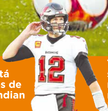
Tom Brady salió de su retiro y regresa con Buccs P.7