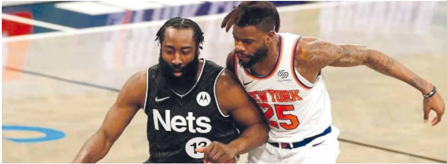
Nuevamente Durant fue la bujía del triunfo de los Nets, ahora ante Knicks.