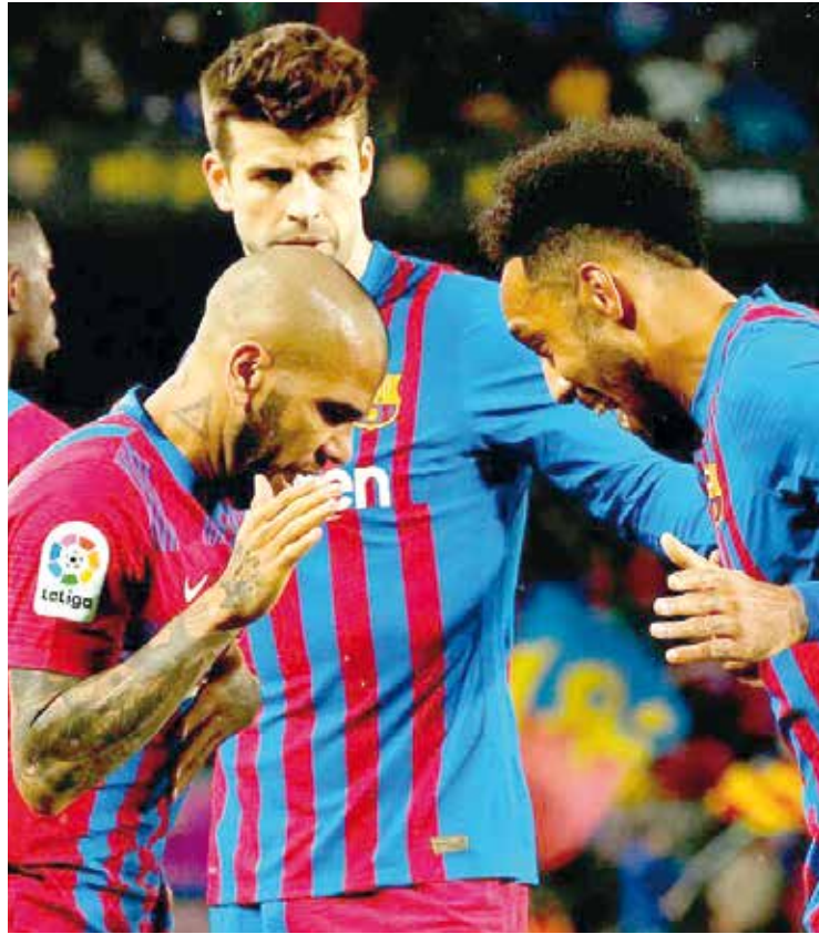
Barcelona celebra un triunfo más.

FÚTBOL El Barcelona se sigue afianzando dentro de LaLiga y liga su cuarto triunfo.