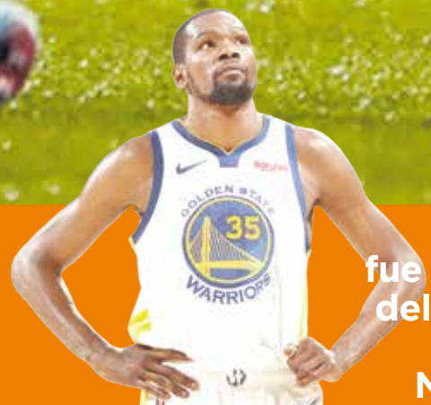
Durant fue la bujía del triunfo de los Nets P.6