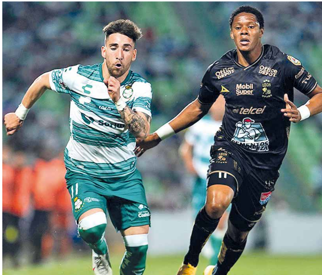
Los Santos de la Laguna logran tremenda victoria ante Tijuana.