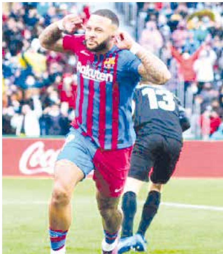
BARCELONA SIGUE GANANDO EN SU NUEVA ERA.

FÚTBOL El equipo comandado por Xavi Hernández sigue su marcha ascendente en LaLiga.