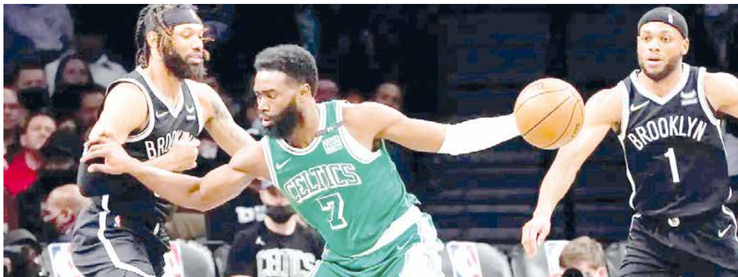
Con marcador de 126-120 los Celtics de Boston ganan a los Nets de Brooklyn.