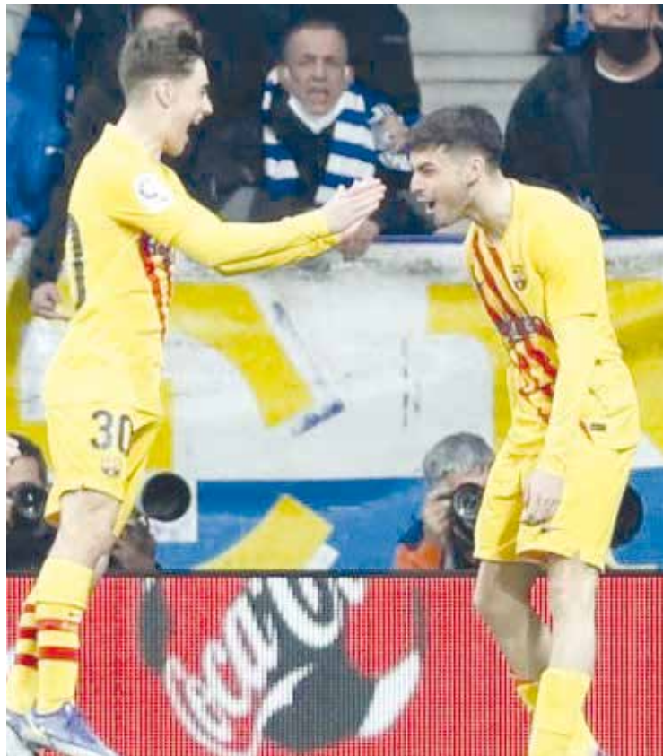
Espanyol y Barça empatan en el Derbi Catalán.

FÚTBOL En lo que fuera uno de los mejores partidos celebrados el domingo termina empatado a dos por bando.