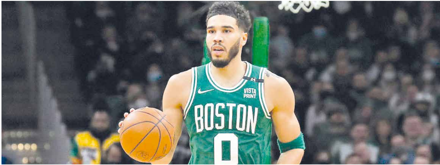
El octavo triunfo de Celtics en forma consecutiva lo consiguen ante Hawks.