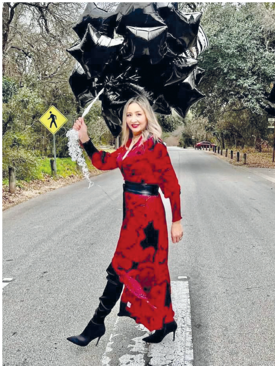
Una sesión de fotos fue el regalo perfecto para recordar una fecha tan especial para ella.