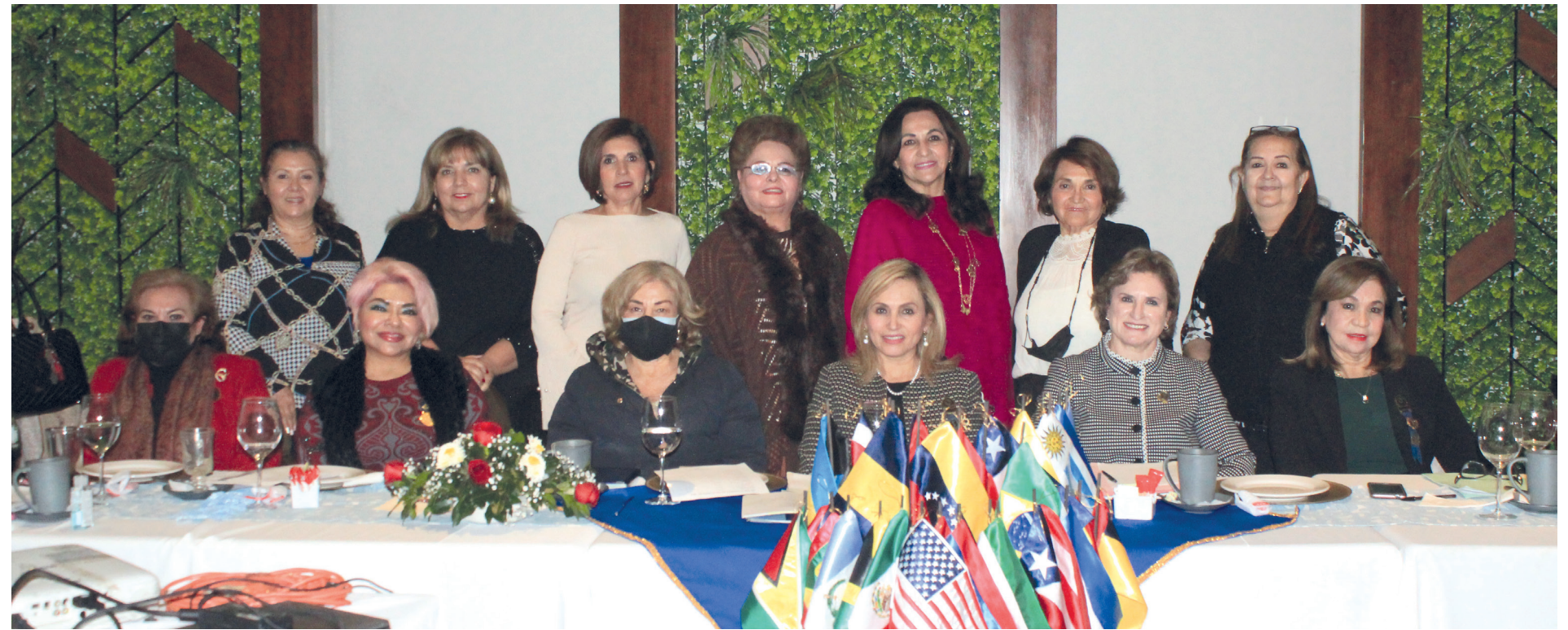
Miembros de la mesa panamericana sesionaron para hablar del país de El Salvador.