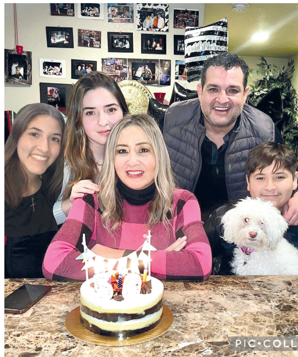
Estuvo acompañada de los seres más importantes en su vida, su esposo y sus hijos.