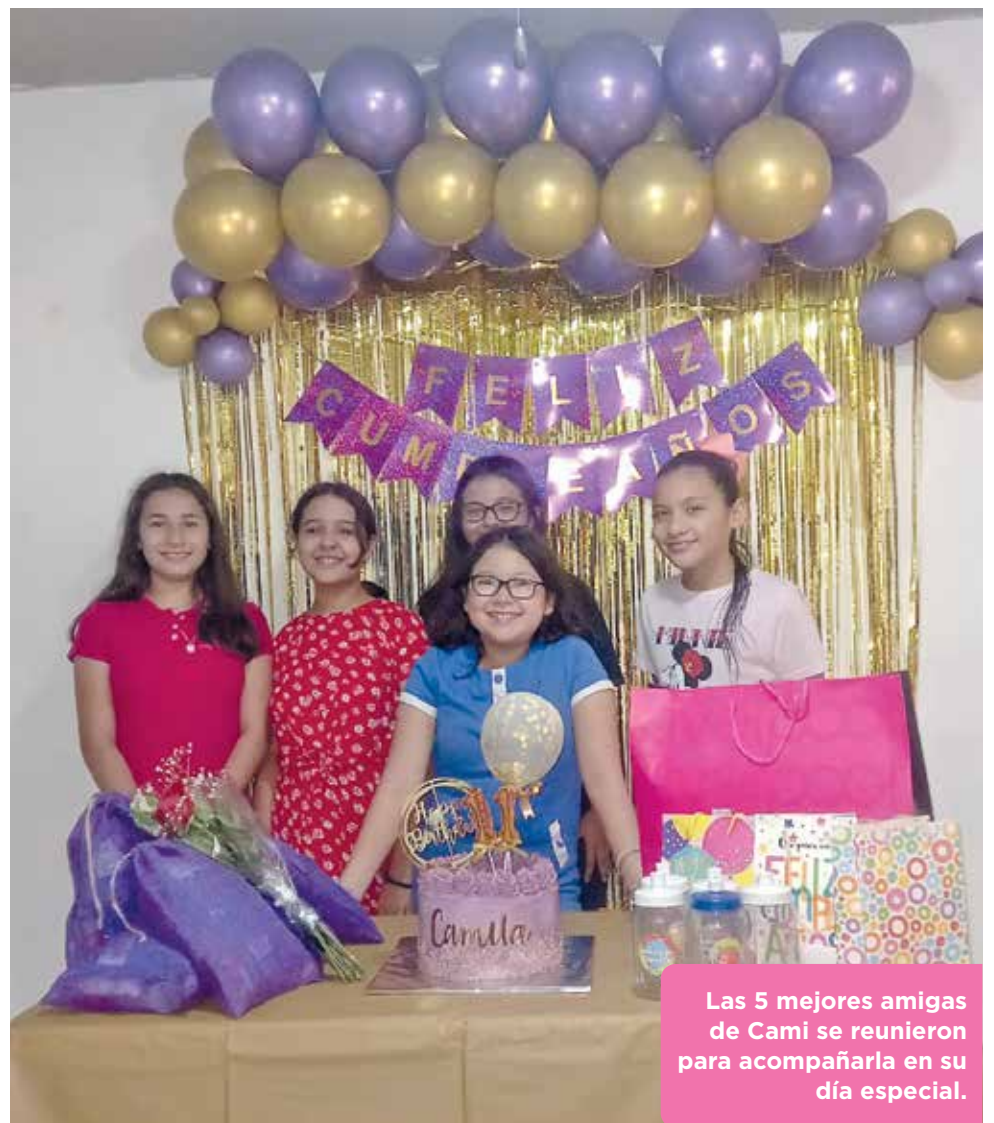
Las 5 mejores amigas de Cami se reunieron para acompañarla en su día especial.