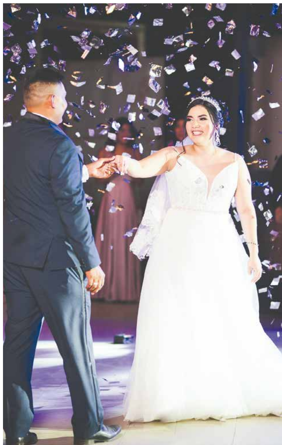
Como dicta la tradición, el festejo comenzó con el vals del novio y la novia.