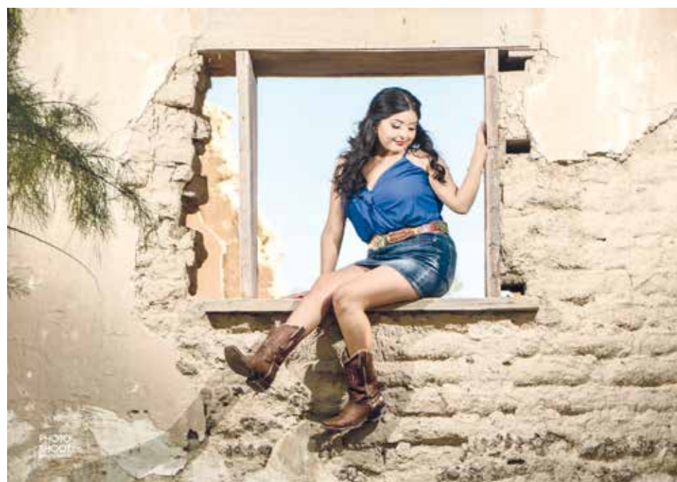
No pudo faltar el estilo vaquero.