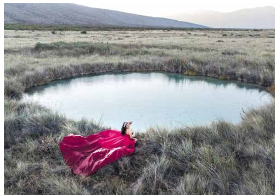
En una de las locaciones favoritas para sus recuerdos.