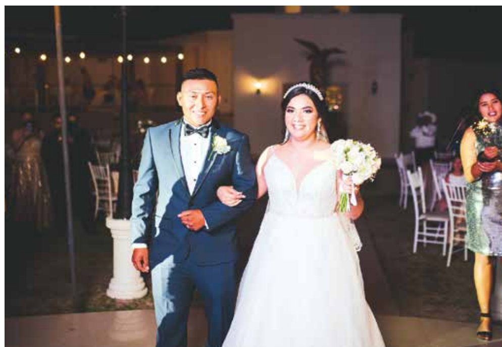
La feliz pareja caminó frente a sus invitados, celebrando el gran enlace de sus vidas.