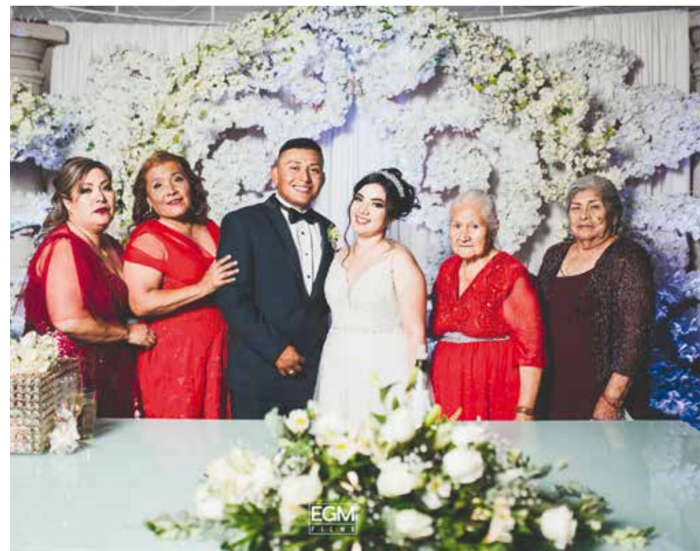
Los novios estuvieron acompañados de sus familias quienes les desearon lo mejor.