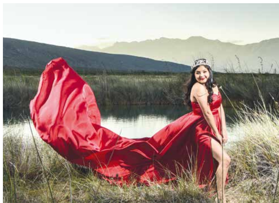
Con un hermoso vestido rojo posó para su sesión de quince años.